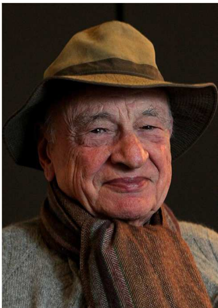
Filosofo e sociologo francese

[...] l'attitudine a contestualizzare e a integrare è una qualità fondamentale della mente umana e ... si tratta di svilupparla piuttosto che di atrofizzarla.