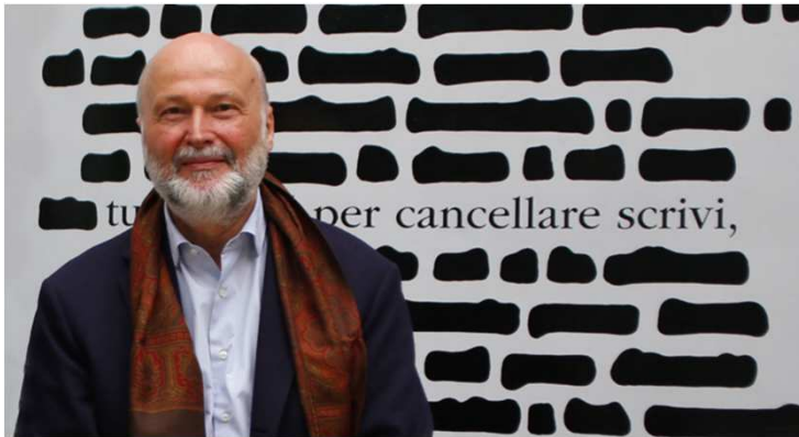
Professore di logica e filosofia della scienza allo IULM

Il nuovo umanesimo planetario, se sarà, sarà prodotto dalla coscienza della comunità di destino che lega ormai tutti gli individui e tutti i popoli del pianeta, nonché l'umanità intera all'ecosistema globale e alla terra.